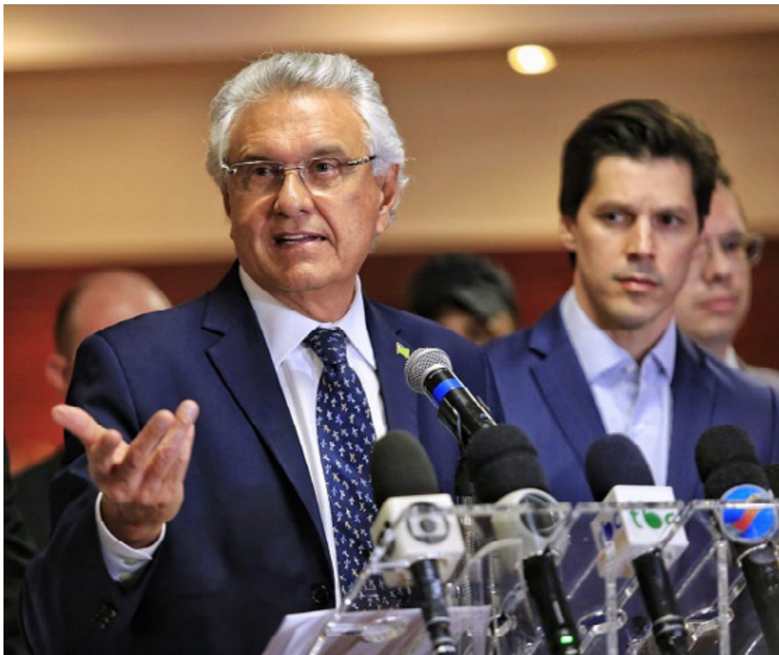
Ronaldo Caiado: gestão com qualidade, valorização dos servidores e prioridades em saúde, educação e segurança

do destacou a necessidade de concluir as obras e projetos em andamento, cumprir o plano de governo apresentado à população em 2022 e não deixar ações inacabadas. O anúncio de ações com recursos já empenhados, e a entrega de obras totalmente finalizadas e em condições de uso, é uma marca da atual gestão, que Caiado não abre mão de manter.