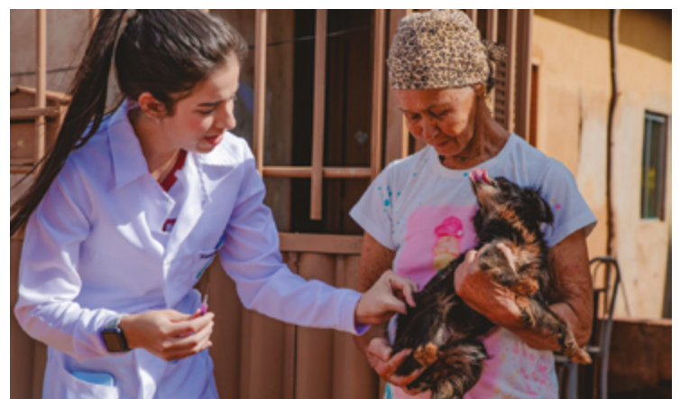
Postos fixos funcionarão de segunda a sexta em outras regiões da cidade

Os animais com suspeita da doença apresentam sintomas como salivação espessa e excessiva, paralisia, falta de apetite, hidrofobia, fotofobia, dilatação das pupilas, além de alterações de comportamento, como agressividade, auto-ataque, cansaço e reclusão em locais escuros.