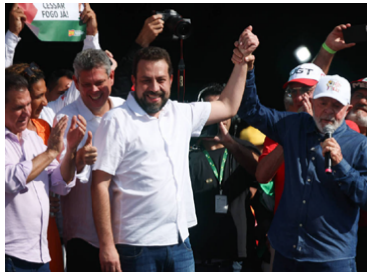
Guilherme Boulos e Lula da Silva no dia 1º de maio: campanha extemporânea

O prefeito afirmou ainda que é preciso ter “certa civilidade”, não utilizar a máquina pública e criticou Lula. “Mas é o que deixa a gente bem triste, sabe? Porque é uma pessoa experimentada, deveria ter um pouquinho de respeito. Ou fez isso calculado. [...] Talvez tinha pouca gente lá e [ele] resolveu criar uma estratégia para poder repercutir”, disse.