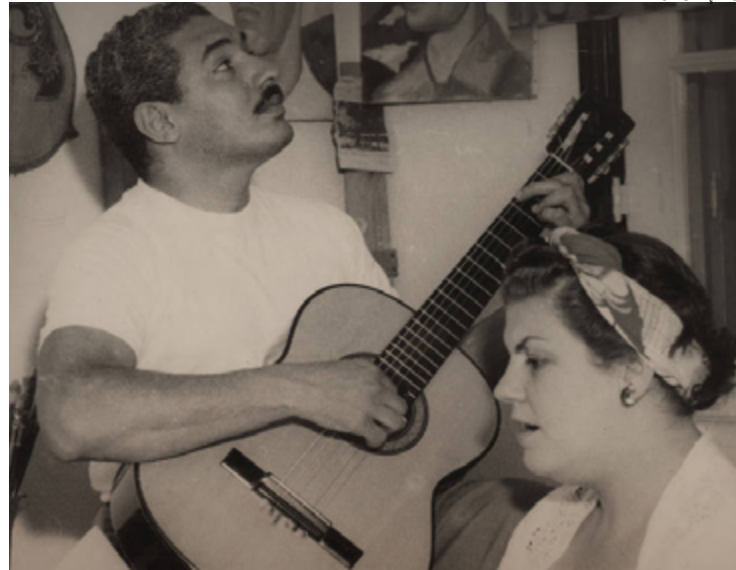
Caymmi e a esposa Stella: artista fala sobre aventuras amorosas