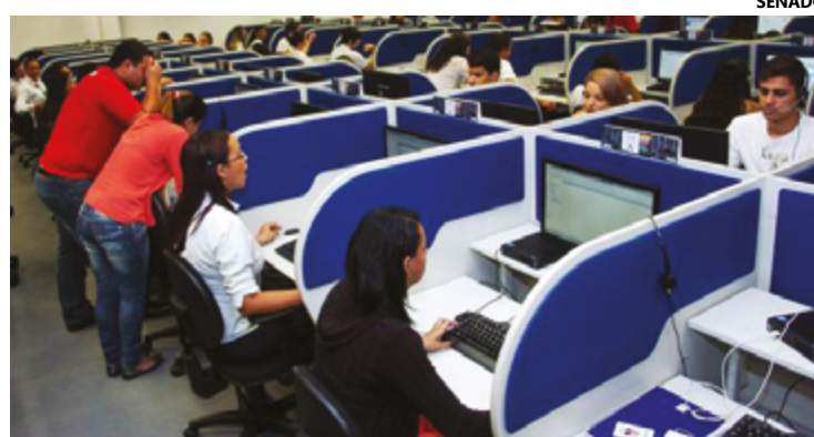
Entre as novas regras, a que protege o consumidor e impede o bloqueio

"Isso acontece diariamente, todos os consumidores recebem essas ligações indesejadas. Para controlar isso, a Anatel exigiu das empresas que insiram,