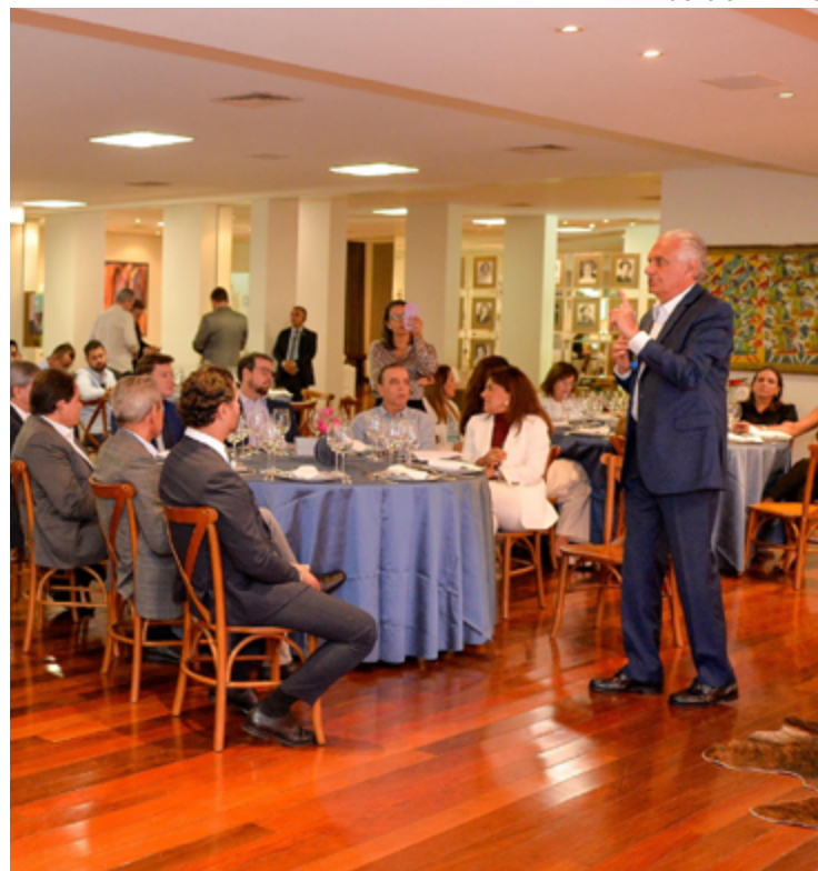
Ronaldo Caiado requer união de empresários e artistas para construir casa de apoio

A construção do Cora, às margens da BR-153, na capital, atingiu a marca de 50% de execução. Neste momento estão em implantação rede de esgoto, tubulações de água, sistema de prevenção e combate a incêndios, piso, sistema de ar-condicionado e instalações elétricas. A unidade terá 148 leitos, dos quais a primeira parte será entregue ainda este ano, na ala pediátrica.