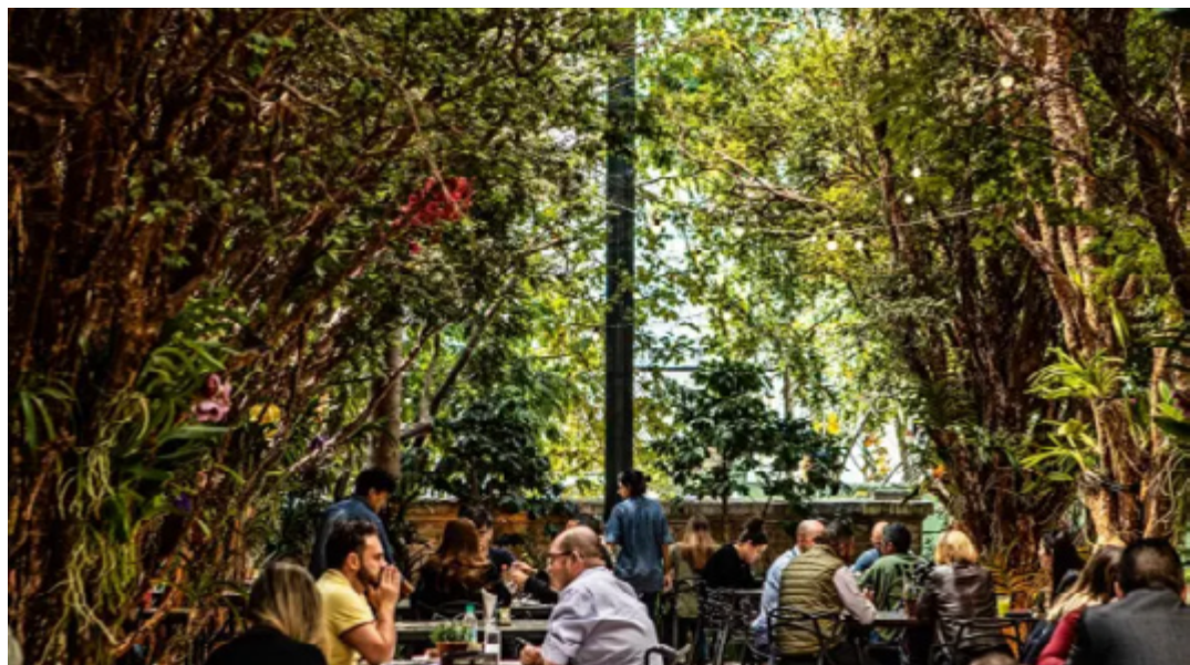
Casa de Don'Anna está localizado no bairro de Campos Elíseos

Com uma atmosfera vibrante e multifacetada, São Paulo possui uma gastronomia diversa para diferentes tipos de gostos e bolsos. Um bom restaurante deve encantar ao escolher e tratar os ingredientes com cuidado e respeito, criando combinações de sabores e aromas únicos. Mas na metrópole não é incomum que a proposta gastronômica também seja traduzida pela atmosfera minuciosamente pensada. Se os espaços de encher os olhos fazem toda a diferença para uma experiência de sensações que uma boa refeição proporciona. Prazeres à Mesa escolheu quatro restaurantes em São Paulo que chamam atenção não só pelo sabor, como também pela arquitetura e o design de interiores.