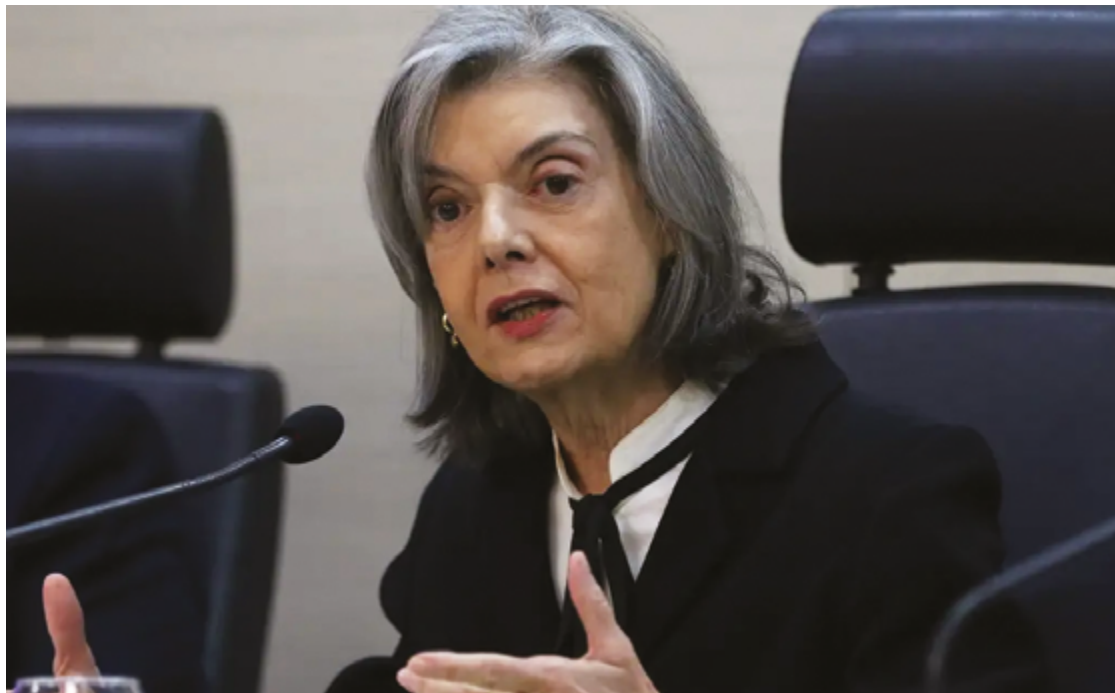
A ministra Carmém Lúcia, do STF, determina que seja proferida uma nova decisão no Habeas Corpus