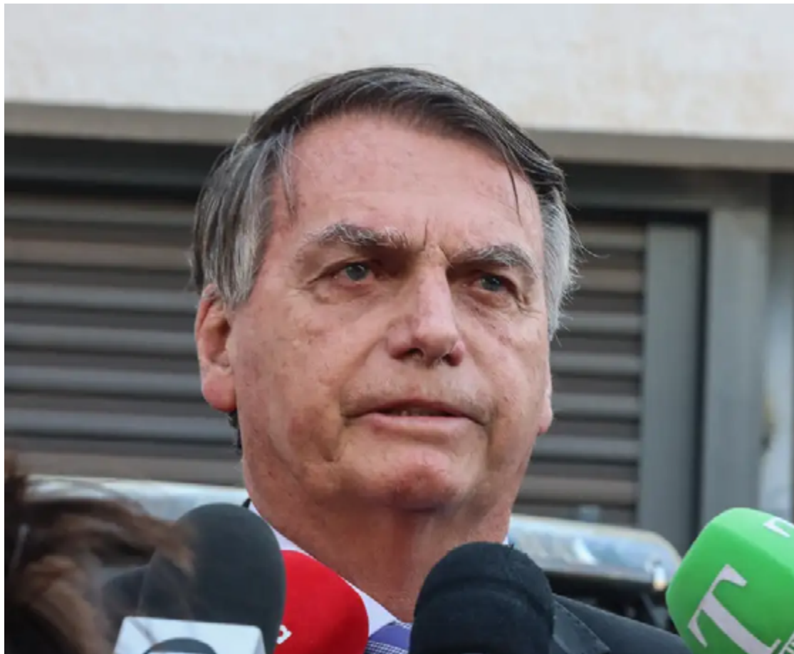
Jair Bolsonaro: inelegível até 2030, por decisão do Tribunal Superior Eleitoral

No discurso, Bolsonaro afirmou que considera o governador de São Paulo “uma pessoa fantástica com uma capaci-