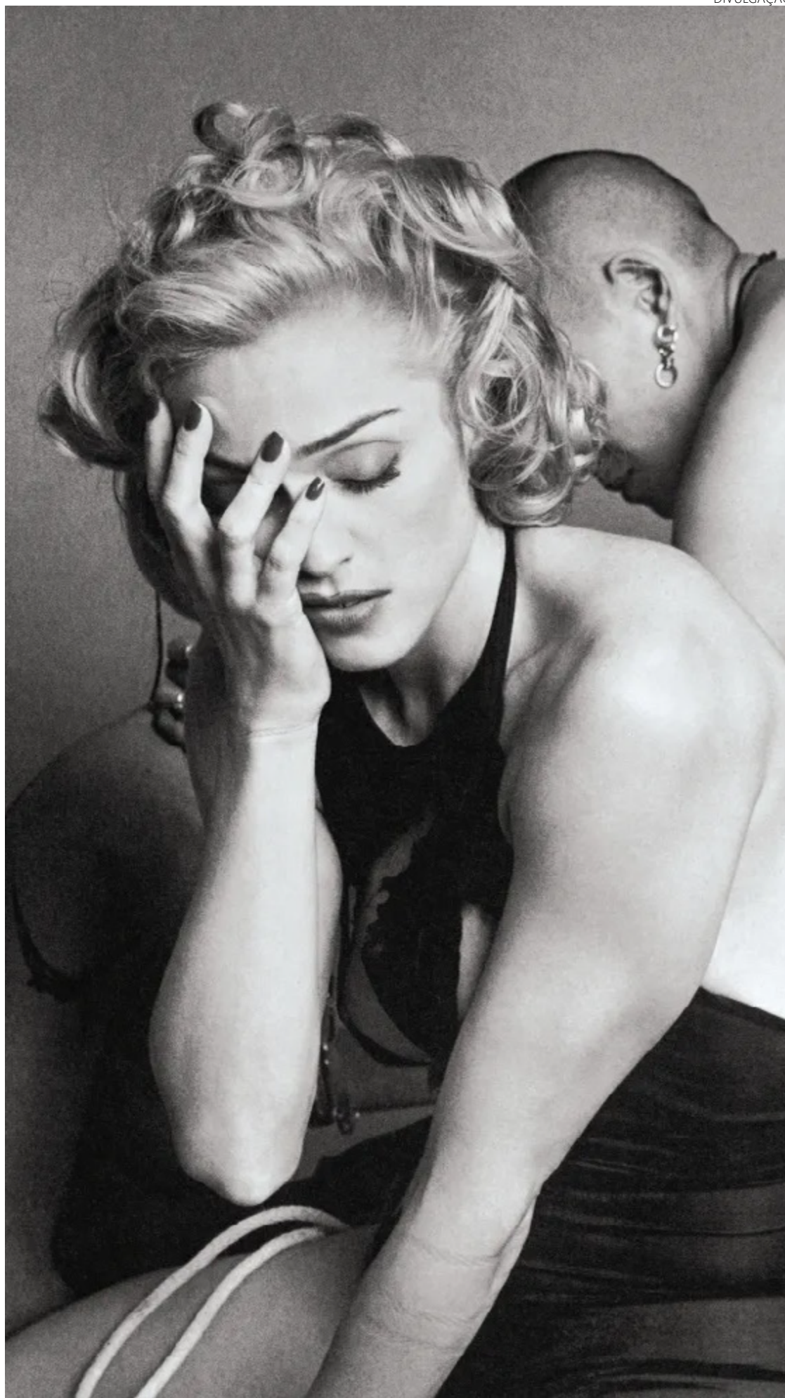
Madonna posa para fotografia de Steven Meisel, que faz parte do livro 'Sex', de 1992

Madonna não virou ícone gay por acaso, ela foi atrás