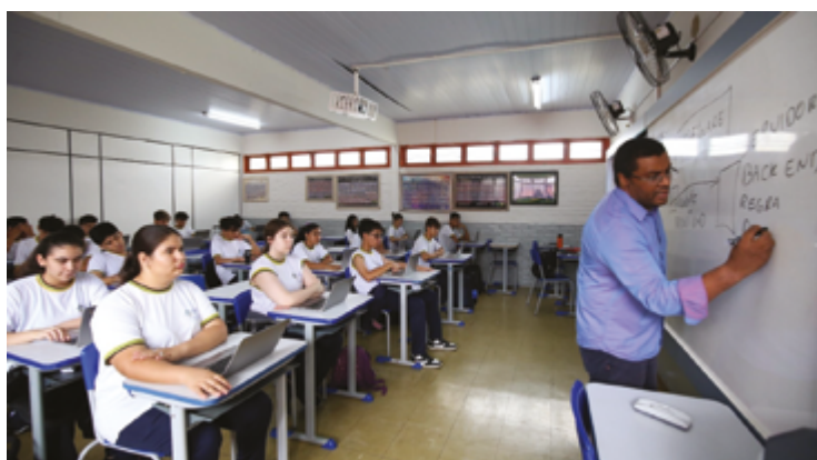
Serviço inclui troca de tampos e nova pintura dos conjuntos escolares

A decisão de priorizar a reforma teve como base a necessidade identificada pelas